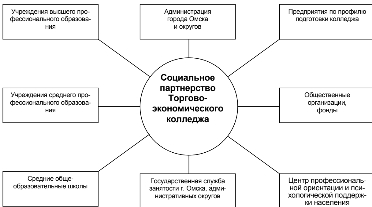
Рис. 4. Структура социального партнерства торгово-экономического колледжа

Общая структура социального партнерства колледжа изображена на рис. 4.